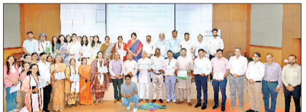
महेंद्रगढ़। समापन पर सर्टिफिकेशन करते हुए।

हरियाणा केंद्रीय विश्वविद्यालय के स्कूल ऑफ इंटरडिसिप्लिनरी एंड एप्लाइड साइंसेज के अंतर्गत पर्यावरण अध्ययन विभाग द्वारा 'सतत एवं जलवायु-संवेदनशील भविष्य के लिए प्राचीन ज्ञान और आधुनिक तकनीक' विषय पर तीसरे दो दिवसीय राष्ट्रीय ईएनओ सम्मेलन का समापन हो गया। पर्यावरण संरक्षण गतिविधियों के सहयोग से आयोजित इस सम्मेलन में विभिन्न राज्यों से आए लगभग 30 पर्यावरण नोडल अधिकारियों (ईएनओ) सहित 150 से अधिक प्रतिभागियों ने हिस्सा लिया। सम्मेलन के दौरान चार तकनीकी सत्र आयोजित किए गए, जिनमें