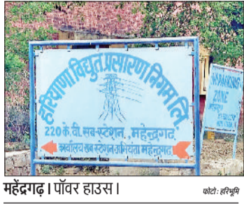
महेंद्रगढ़। पाँवर हाउस।