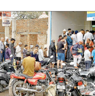
नारनौल। पुलिस लाइन के सामने गैस एजेंसी के सामने लगी उपभोक्ताओं की कतार।