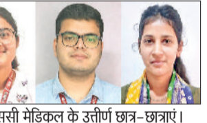
बीएससी मेडिकल के उत्तीर्ण छात्र-छात्राएं।

बीएससी मेडिकल के पांचवें सेमेस्टर का परिणाम घोषित किया