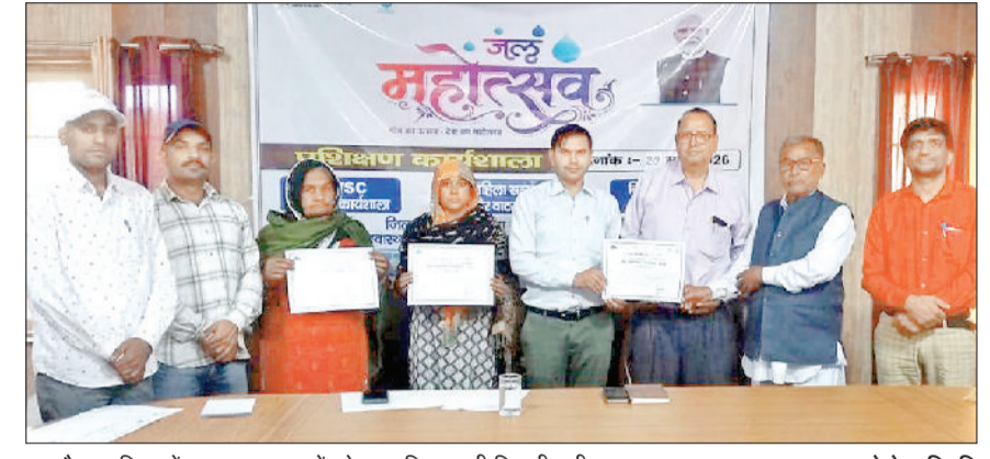
नारनौल। महिलाओं व नलकूप चालकों को सम्मानित करती विभागीय टीम।

सिंहमा खंड की मेंड, हुडिना, रामपुरा, फैजाबाद, अकरपुर रामू, मित्रपुरा, शहरपुर, आजमनगर व