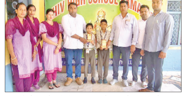
नांगल चौधरी। मेधावी बच्चों को सम्मानित करती स्कूल की प्रबंधन कमेटी।

मेधावी बच्चों को स्कूल के चेरमेन ने प्रशंसा पत्र देकर सम्मानित किया