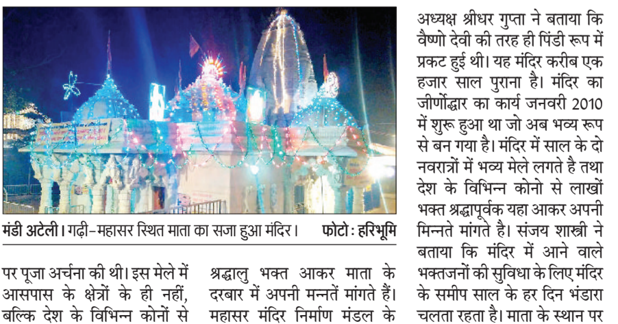
मंडी अटेली। गढ़ी-महासर स्थित माता का सजा हुआ मंदिर।

पर पूजा अर्चना की थी। इस मेले में आसपास के क्षेत्रों के ही नहीं, बल्कि देश के विभिन्न कोनों से श्रद्धालु भक्त आकर माता के दरबार में अपनी मन्त मांगते हैं। महासर मंदिर निर्माण मंडल के