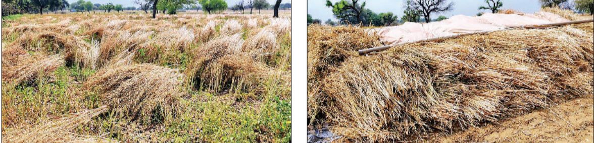
नारनौल। खेत में पड़ी कटाई की गई सरसों। व बारिश से बचाने के लिए एकत्रित की गई सरसों पर डाला तिरपा।