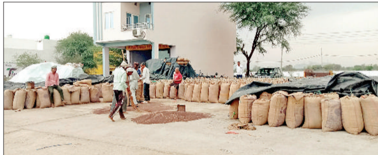
नारनौल। अनाज मंडी में पहुंची सरसों की खरीद करते हुए।

उन्होंने नया अधिकारियों को फोर्गिंग मशीन खरीदने तथा वार्ड वाइज स्प्रे कराने के निर्देश दिए। तर्क दिया कि ग्रीष्मकाल में कीटाणुओं का