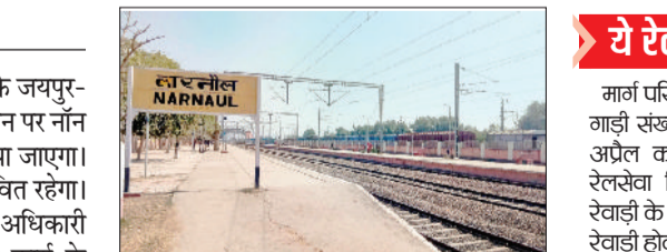
नारनौल। रेलवे स्टेशन।