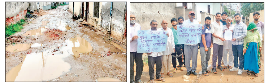
नारनौल। गांव जैलाफ में मुख्य रास्ते में जमा पानी। गांव जैलाफ में प्रदर्शन करते ग्रामीण।